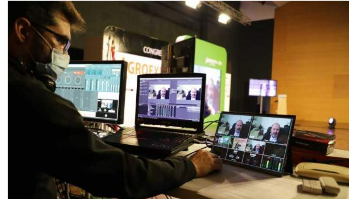
Emisión en streaming