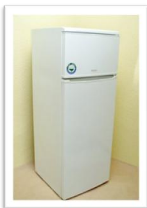
Ref. 205 Altura: 144 cm (máx) Anchura: 54 cm Fondo: 56 cm