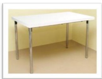
Ref. 210 Altura: 75 cm Anchura: 120 cm Fondo: 70 cm