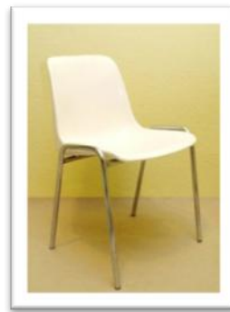
Ref. 221 Altura: 78 cm Anchura: 50 cm Fondo: 40 cm