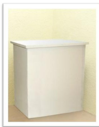
Ref. 214 Altura: 104 cm Anchura: 106 cm Fondo: 52 cm