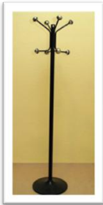
Ref. 217 Altura: 176 cm