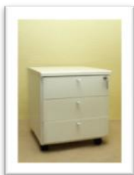
Ref. 201 Altura: 53 cm Anchura: 49 cm Fondo: 52 cm