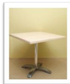
Ref. 211** Altura: 74 cm Anchura: 79 cm Fondo: 79 cm