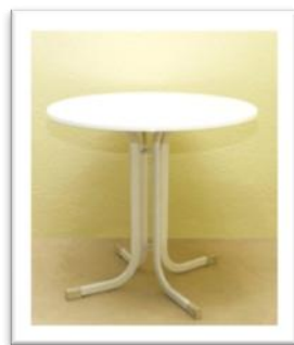
Ref. 211* Altura: 73 cm ∅ 80 cm