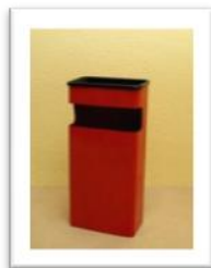
Ref. 202 Altura: 68 cm Anchura: 33 cm Fondo: 20 cm