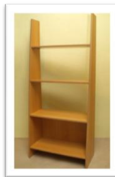
Ref. 204 Altura: 180 cm Anchura: 81 cm Fondo: 40 cm