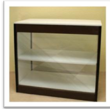
Ref. 216 Altura: 92 cm Anchura: 102 cm Fondo: 53 cm