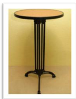
Ref. 206 Altura: 108 cm ∅ 60 cm