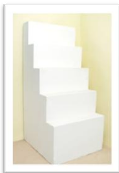
Ref. 203 Altura: 180 cm Anchura: 82 cm Fondo: 91 cm