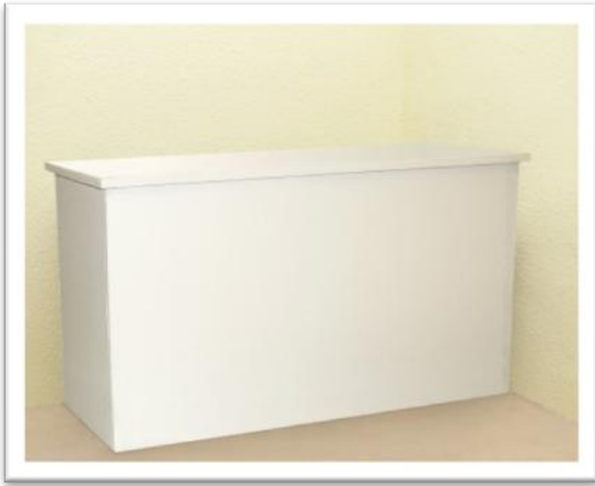
Ref. 215 Altura: 104 cm Anchura: 186 cm Fondo: 52 cm