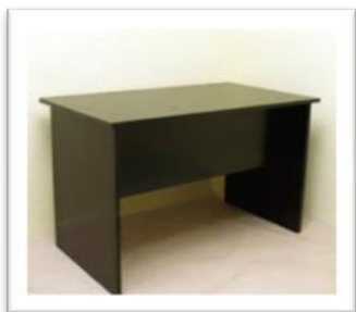
Ref.209 Altura: 75 cm Anchura: 120 cm Fondo: 70 cm