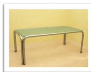
Ref 207 Altura: 40 cm Anchura: 104 cm Fondo: 55 cm