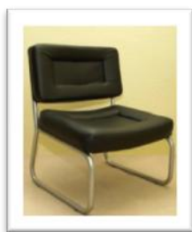
Ref. 213 Altura: 67 cm Anchura: 57 cm Fondo: 47 cm