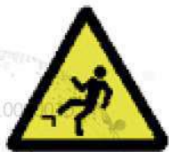
Riesgo de caída a distinto nivel