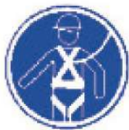
Protección individual obligatoria contra caída en trabajos a más de 3,5 m. y recomendable a partir de 2 m.